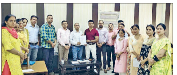
जीट। मांगों को लेकर ज्ञापन सौंपते प्राध्यापक।

राजकीय महिला महाविद्यालय की स्थानीय ईकाई ने गुरुवार को प्राचार्य कार्यालय के समक्ष एकत्र होकर पंचकूला सेक्टर एक के राजकीय महाविद्यालय में सहायक प्राध्यापक पर हुए जानलेवा हमले की घोर निंदा की। दोपहर को सभी शिक्षक व शिक्षिकाएं एकजुट होकर डीसी कार्यालय पहुंचे और प्राचार्य के माध्यम से ज्ञापन सौंपा गया। ज्ञापन में मांग की गई कि दोषियों को शीघ्र गिरफ्तार कर उनके विरुद्ध कठोर कानूनी कार्रवाई की जाए तथा महाविद्यालय परिसरों और उनके