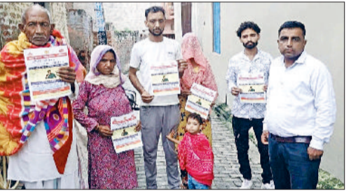
जीट। ग्रामीणों को जागरूक करते हुए।