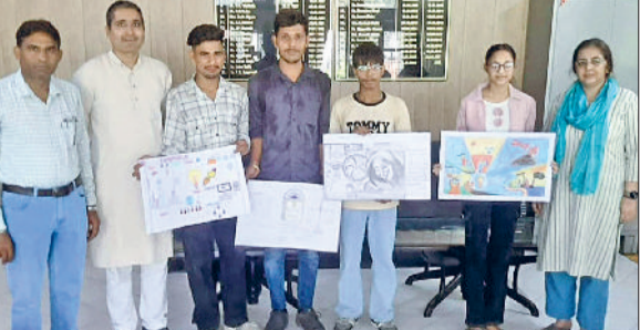
नरवाना। कॉलेज में आयोजित प्रतियोगिता में भाग लेने वाले विद्यार्थी।