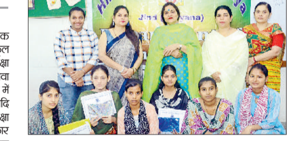
जीट। प्रतियोगिता की विजेता छात्राएं प्राचार्यों के साथ।