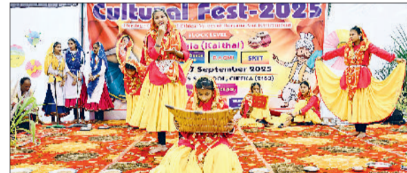
गुहला चीका। हरियाणा की माटी से जुड़ी प्रस्तुतियों में अपना हुनर सांस्कृतिक मंच पर रंगा रंग प्रोग्राम करते हुए विद्यार्थी।