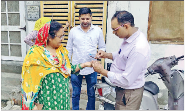
जीट। रक्त के सैमल लेते हुए स्वास्थ्यकर्मी।

200 से अधिक टीमों कर रही लोगों को जागरूक