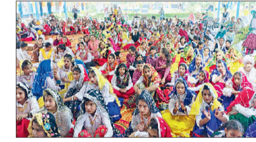
अलेवा। नगरों राजकीय कवमावि में कार्यक्रम के दौरान उपस्थित छात्राएं।